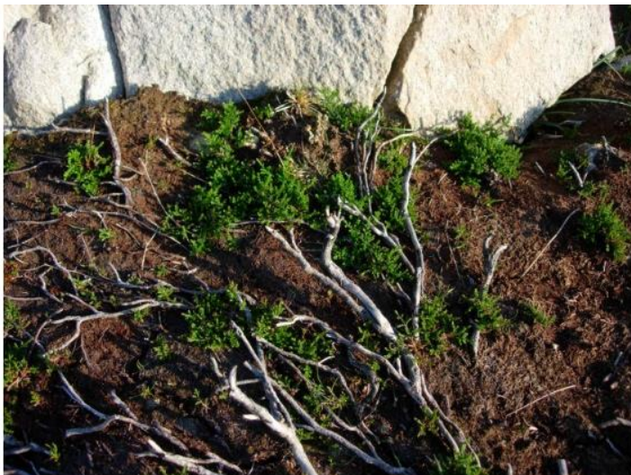
Ny lyng etter brenning.

(Brenning av lokalitetane som er godkjende under Tilskot til beiting av kystlynghei)