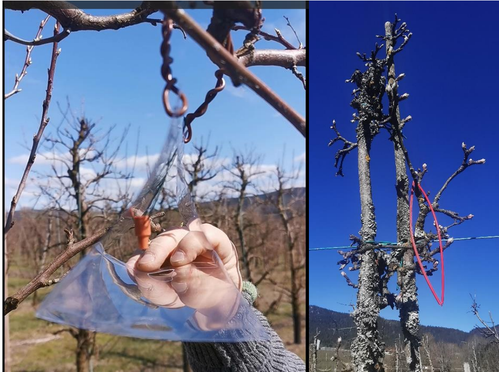
Bilete 2: til venstre: feromonfeller bør hengast opp no for overvaking av viklarar. Bilete til høgre viser rett oppheng av feromonforvirring Isomate CLS.