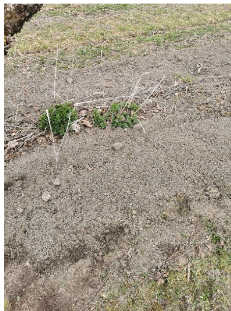
Set ein igjen hanekammen på midten, må denne slåast eller fjernast på anna måte. Spesielt brennesle kan fort vekse seg høg.