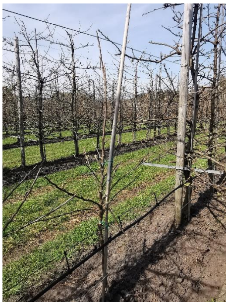
En runde ugrasfresing til før blomstring skal være mogleg, trea er nå på grøn ballong.

Planlegg å få frest kvar tredje veke fram til blomstring. Når det blomstrar bør trea ikkje bli stressa med ugrasreinhold. Bruk då maskiner som går langs rada eller vent til blomstringa er ferdig.