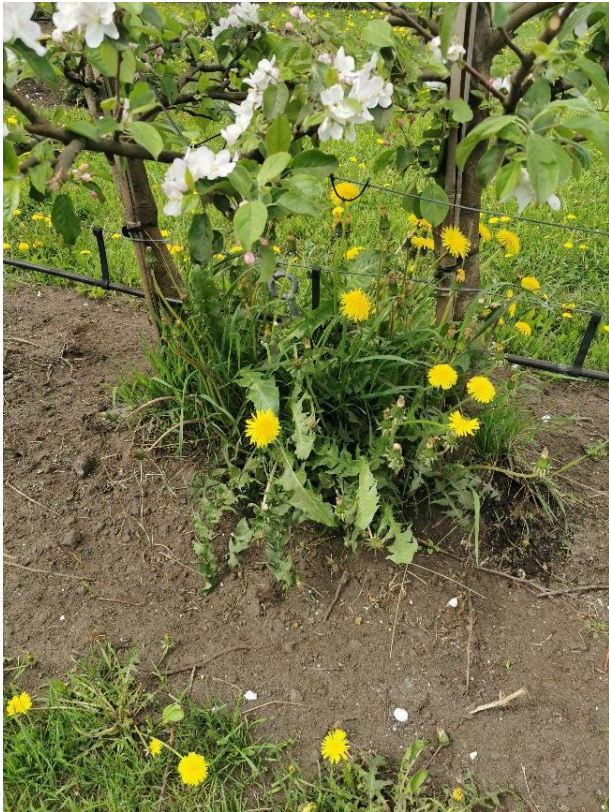
Bilete 2: handluking må til mellom trea om avstanden ikkje er stor nok til at ugrasfresen går innimellom.

Unngå ugrasfresing under blomstringa. Handluking kan ein naturlegvis gjere.