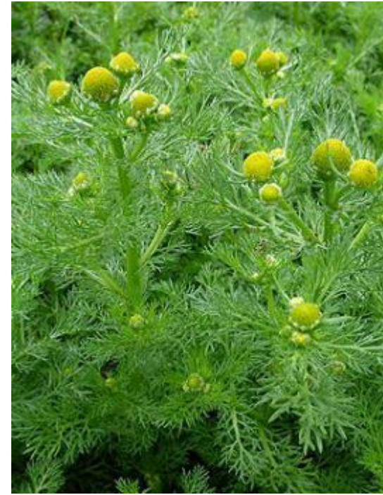
Tunbalderbrå - Lepidotheca suaveolens