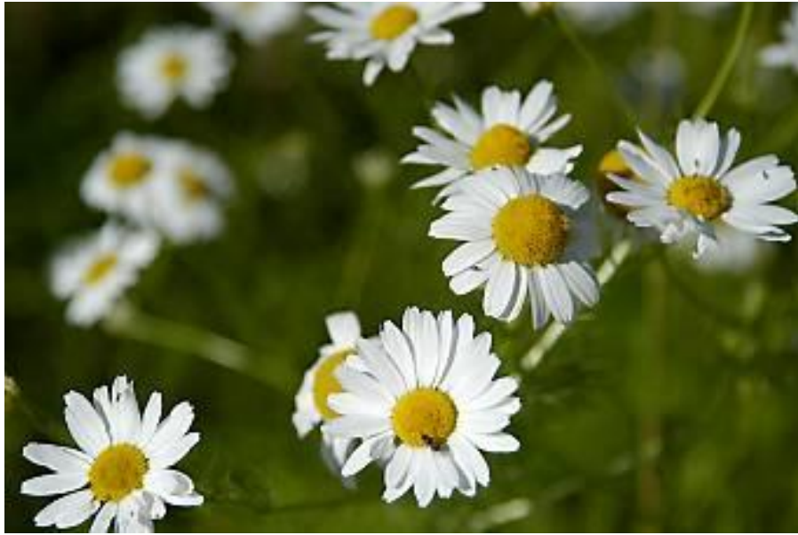
Balderbrå - Tripleurospermum inodorum