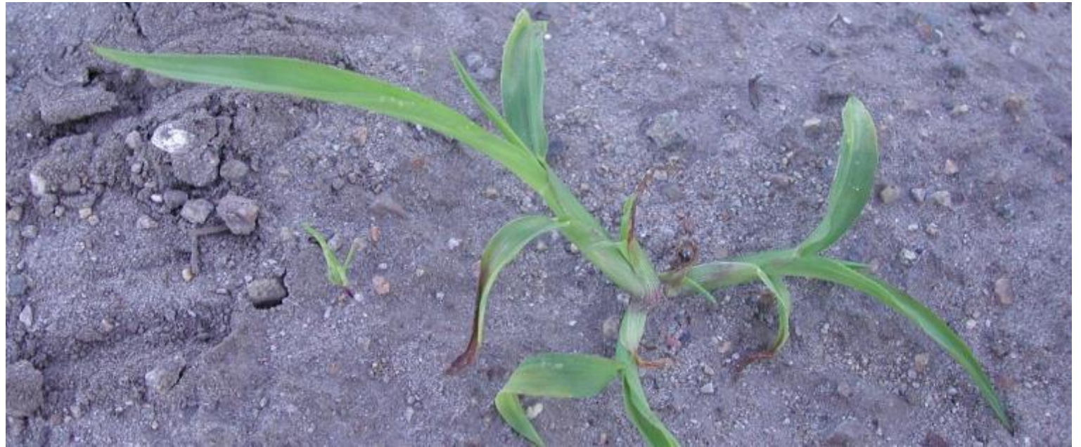
Hønsehirse - Echinochloa crus-galli