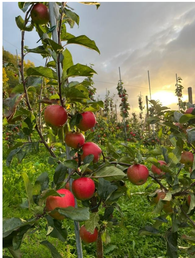
Fryd i Sogn, 3. oktober 2022

Innhausting av plomme og pære er no overstått saman med dei fleste eplesortar. Det er berre hausting av dei seinaste eplesortane som står att. Sortar som kjem etter Aroma er t.d. 'Rubinstep', 'Santana', 'Elstar', 'Ingrid Marie', 'Holsteiner Cox' og 'Fryd'. Haustinga av fleire av dei seine sortane er også godt i gang fleire stader i landet.