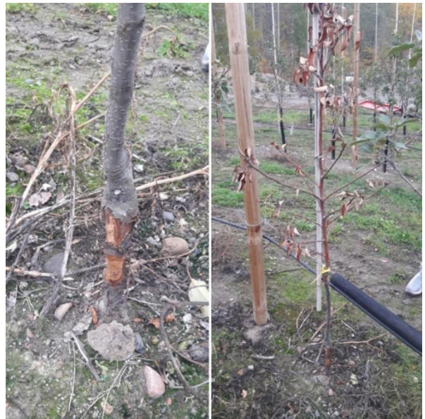
Ungt tre med frukttrekraft i overgangen frå grunn-stamme. Treet er daudt og må fjernast.