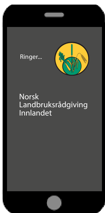
Rådgivere tilgjengelig på telefon gjennom hele året.