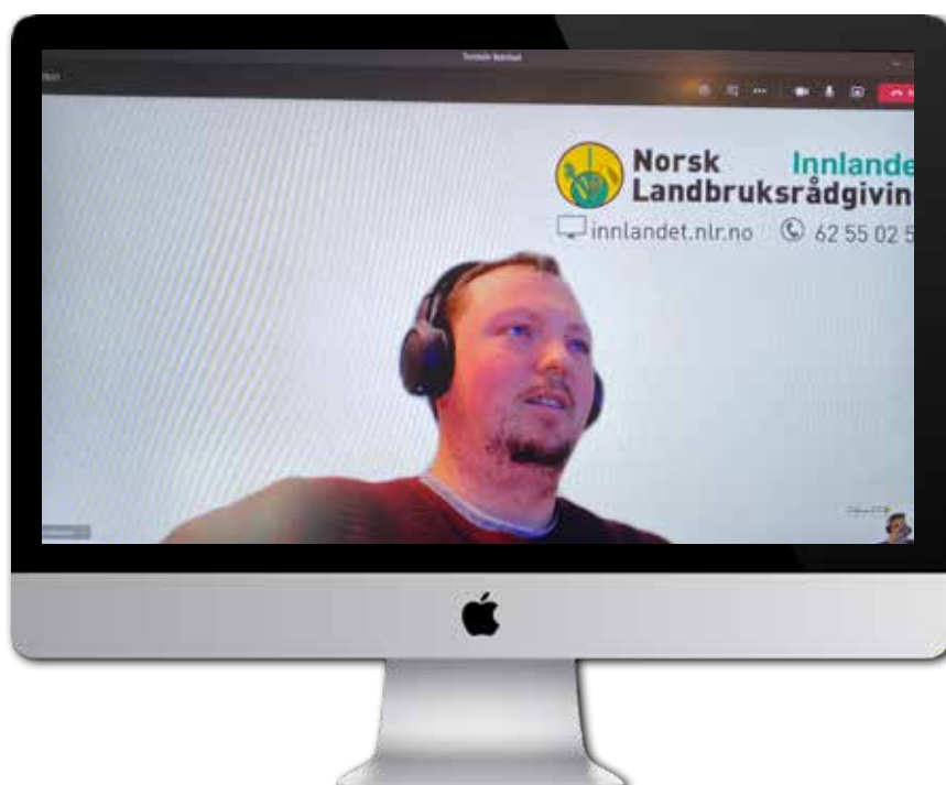
I tillegg til ukentlige e-poster har våre rådgivere denne sesongen vært å treffe på Teams.