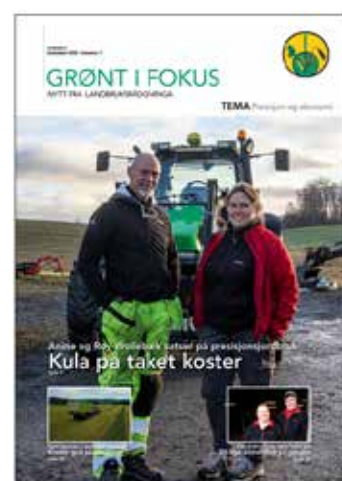
Medlemsbladet Grønt i fokus med fire utgivelser og 9000 i opplag.