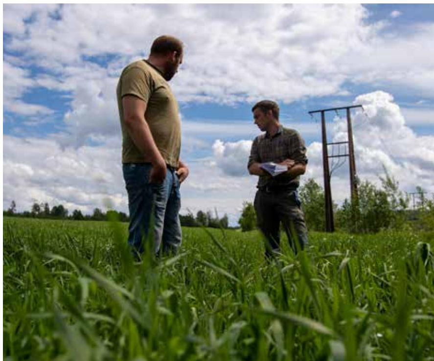
Besøk av rådgiver i vekstsesong.